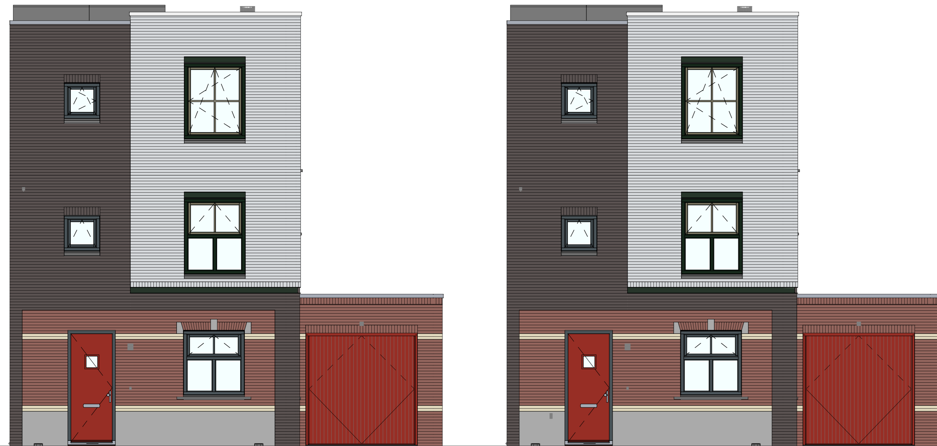
VG5001 - Voorgevel in basis uitvoering