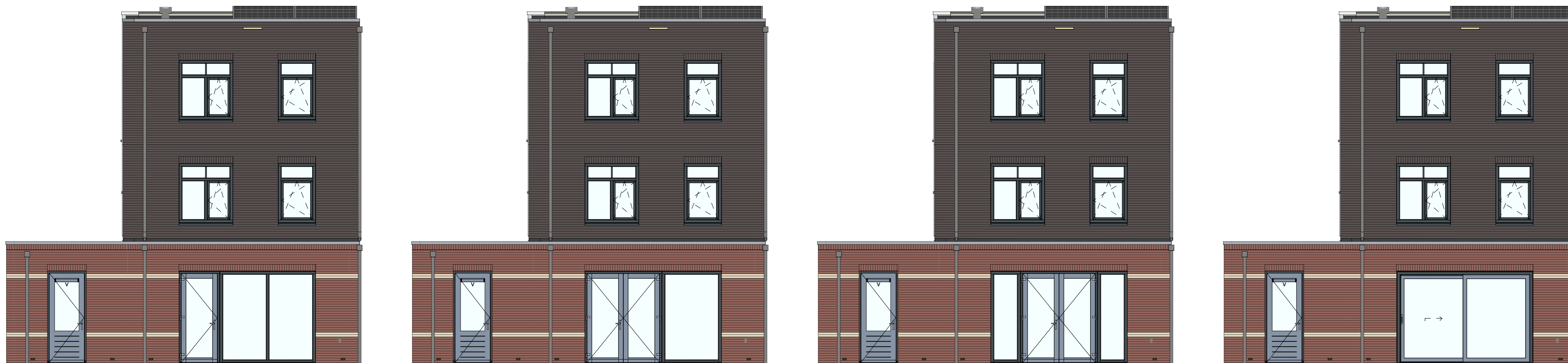
AG5001 - Achtergevel in basis uitvoering